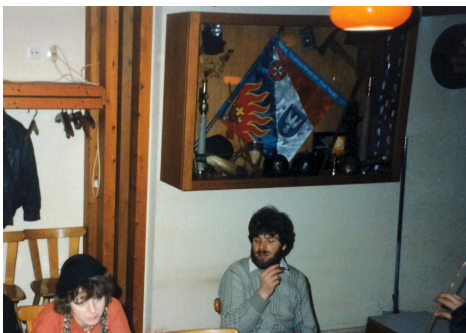
Vitrine im Rössli mit Standarte, Hauptversammlung 23.01.1988